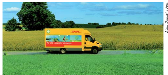
Statt auf Ganzjahresreifen demnächst mit Saisonbereifung von Michelin unterwegs: Pakettransporter der Deutschen Post.

Den Aufwand rechnet Michelin Fleet Solutions mit dem Kunden über eine Kilometerpauschale ab. Vorteil für die Deutsche Post DHL Fleet: Keine Fahrzeugüberführung zur Werkstatt und bedarfsgerechte Bezahlung, da nur die tatsächliche Kilometerleistung berechnet wird.