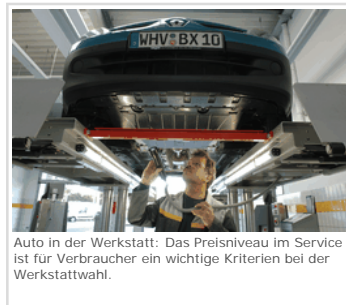
Auto in der Werkstatt: Das Preisniveau im Service ist für Verbraucher ein wichtige Kriterien bei der Werkstattwahl.

Losheim am See. Der Preis spielt für Autofahrer bei der Wahl ihrer Werkstatt eine zunehmend wichtige Rolle: 83 Prozent der Kunden geben an, günstige Preise für Wartung und Reparatur seien für sie ein wichtiges Auswahlkriterium – im Vorjahr betrug diese Quote noch 77 Prozent. Das hat die Kraftfahrzeug-Überwachungsorganisation freiberuflicher Kfz-Sachverständiger (KÜS) bei einer repräsentativen Umfrage ermittelt. Für die Umfrage spielte es keine Rolle, ob die Fahrer Kunden einer freien oder markengebundenen Werkstatt waren. Befragt wurden im Auftrag der KÜS insgesamt 1000 Autofahrer in Deutschland durch das Kölner BBE Automotive-Institut.