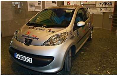
Auf dem IAA-Messestand der KÜS steht eines der Versuchsfahrzeuge des Projekts – ein Peugeot 107.