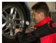
Aktion ‚Wash-Check‘: Geprüft wurde unter anderem der korrekte Reifendruck.

Dabei hat man laut KÜS bei 35,55 Prozent der Fahrzeuge Mängel festgestellt. Im Jahr 2008 waren es 25,14 Prozent. Bei 9,52 Prozent der geprüften Automobile lag das Reifenalter bei über sechs Jahren, 9,34 Prozent waren mit einer Profiltiefe von unter drei Millimetern unterwegs. Einen falschen Luftdruck in den Reifen hatten 7,18 Prozent der gecheckten Verkehrsteilnehmer und insgesamt 2,33 Prozent hatten weniger als 1,6 Millimeter Profil auf ihren Reifen.