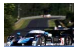
Le Mans: Peugeot holt die Dreifach-Pole