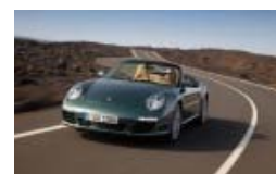
Porsche 911 Facelift 2008