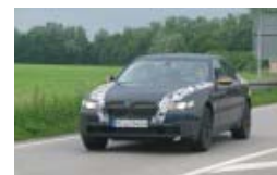
Erlkönig: BMW 7er