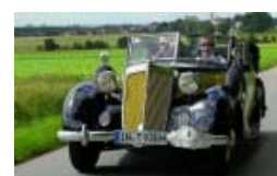
Donau Classic 2008