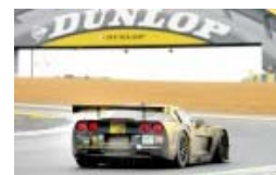
Zweiter und dritter Rang für Corvette