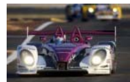
Porsche gewinnt Qualifying