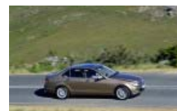
Mercedes Blue Efficiency