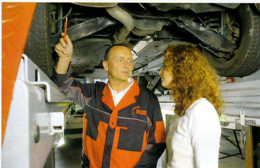
Der KÜS-Prüfingenieur bei der Gebrauchtwagen-Bewertung.

B ei der wachsenden Zahl von neuen Automobilen, die teils in immer kürzeren Produktlebenszyklen in den Markt gedrückt werden, ist die Transparenz im Gebrauchtwagenmarkt zunehmend schwieriger geworden. Wie soll man also in dieser Situation, die sich für Hersteller, Handel und Kunden gleichermaßen vielschichtig darstellt, einen Überblick verschaffen? Wer den Kauf eines Neu- oder Gebrauchtwagens plant, hat vielfältige Möglichkeiten, sich über das Angebot und insbesondere die Preise zu informieren. Infos zur aktuellen Neuwagen-Palette gibt's ohnehin reichlich. Angefangen beim Vertragshändler, über die Autoseiten der Tageszeitungen bis hin zu den einschlägigen Magazinen und nicht zuletzt über das Internet kann man sich auf verschiedenste Weise schlau machen.