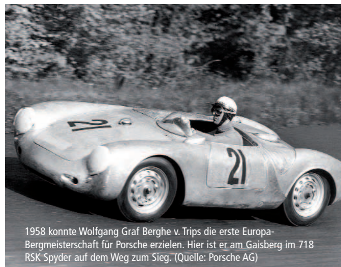
1958 konnte Wolfgang Graf Berghe v. Trips die erste Europa-Bergmeisterschaft für Porsche erzielen. Hier ist er am Gaisberg im 718 RSK Spyder auf dem Weg zum Sieg.