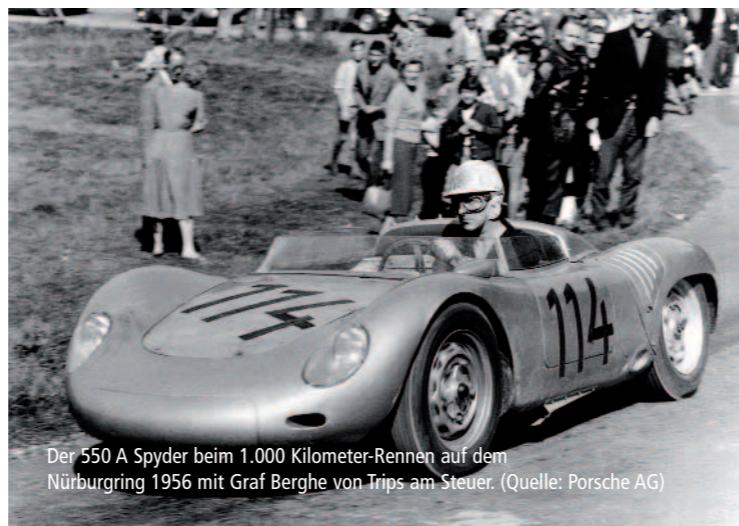
Der 550 A Spyder beim 1.000 Kilometer-Rennen auf dem Nürburgring 1956 mit Graf Berghe von Trips am Steuer.

Am 4. Mai 2008 wäre Wolfgang Alexander Graf Berghe von Trips 80 Jahre alt geworden – Deutschlands vielleicht größter Rennfahrer