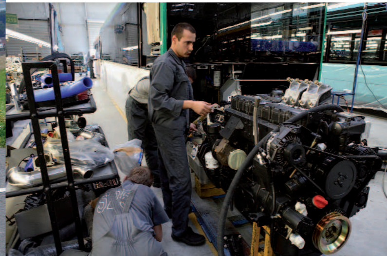
Die Solaris-Arbeitsstätten in Bolechowo. In diesem Jahr sollen das Werk 1.000 Busse verlassen.

Annähernd 4.000 Fahrzeuge lieferte Solaris Bus & Coach in seinem zwölfjährigen Bestehen bisher aus. Im Grunde genommen ist das Unternehmen unweit vom westpolnischen Poznan ein „Kind des Kalten Krieges“.